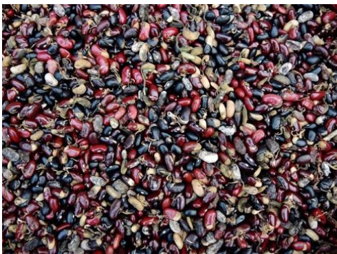
Sprouted beans caused by early rain destroying the majority of 2017 bean harvest.

In April 2017, changing rain patterns in the area delivered unusually early rains that destroyed the annual bean harvest. The bean crop failure was a blow to food security, child health, and the family economy among the indigenous communities who depend on beans as their main protein source, their currency for trading for other foods and goods, and seed for the following year. People described the partially sprouted, shriveled beans as having a petroleum-taste and being inedible. Much of the bean crop was destroyed and the communities are distraught with the fear of imminent hunger and long-term food insecurity due to lack of a seed source for next year's crop. Bean seed aid planted in the beginning of the dry season November 2017 grew well until heavy rains destroyed flowers and young bean pods. As of February 2018, Miskitu communities are again fearful for their food security as they watch second year of beans fail. Changing climate conditions aggravate their ability to persist on their land and withstand colono attacks.