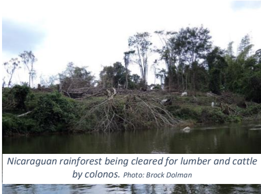
Nicaraguan rainforest being cleared for lumber and cattle by colonos .

health for millennia. From 2000-2010, up to a third of the Bosawas Preserve was deforested by non-native settlers, called colonos , moving into indigenous territory. The past seven years have seen an even more rapid increase in logging.