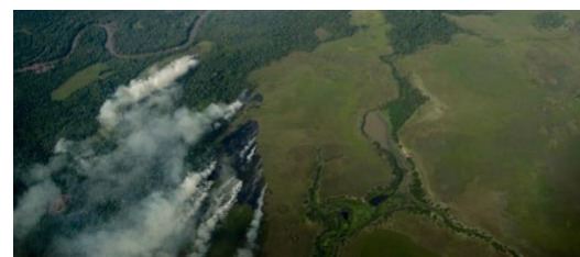
Recently burned rainforest ready for cattle.