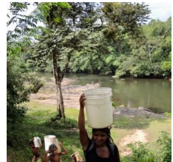
Women and children of Esperanza Rio Wawa quickly haul water from the river while safe from shooting colonos .

Paiwas have been attacked in the night and burned to the ground, creating more than 3,000 refugees 2 of indigenous people in their own territory. The worst of the violence has taken place in the 4,000-sq. km. between the Rio Coco and Rio Wawa, south of the border with Honduras. 3 Indigenous villages are unable to access food resources because the colonos have taken claim of the land and cut them off from their rice and bean fields, hunting and gathering areas, and, in some cases, water sources, making it difficult for indigenous forest dwellers to remain in their villages.