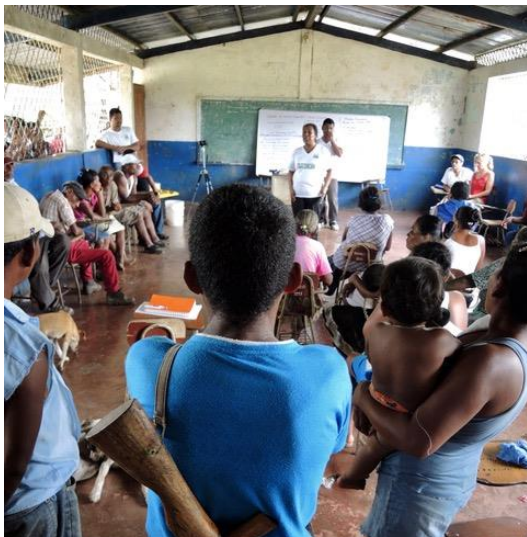
Esperanza Rio Coco community meeting with their legal advocates, CEJUDHCAN.

Villagers have resisted attacking colonos except for self-defense. They believe in their lawyers and in the possibility of a legal solution to their situation. However, with the continuing deadly attacks combined with the bean crop failure, tensions are running high. Legal teams has made it clear they will not represent indigenous people who break the law in any way including attacking colonos . As legal representatives to the Miskitu, they have taken hundreds of testimonies of violence and beseeched communities to stay committed to each other and the legal process. However, Miskitus say they would rather die fighting then sit and watch their families starve to death. Communities must get relief from the invasion as well as get rapid food and seed relief, otherwise the consequence will be the permanent and irreversible loss of a culture.